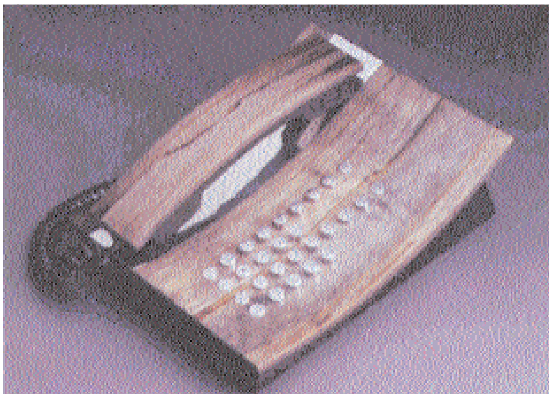
Telefon dekorert med soppfarget lauvtrevirke (Helset, Sanne og Rosmo).