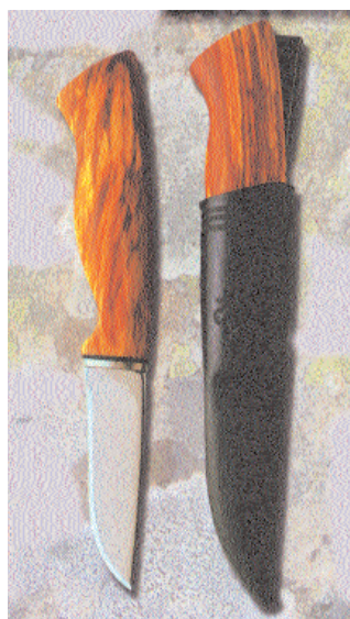
Kniv i soppfarget bok (Helle Fabrikker).