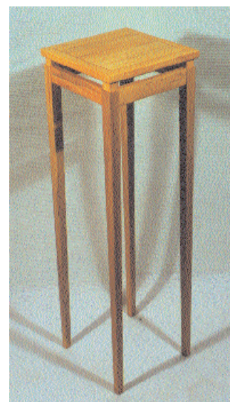
Bord i soppfarget materiale (Arne Eide).