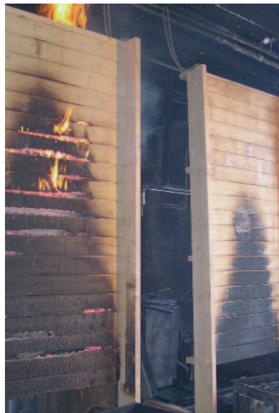
Brannimpregnert tre var selv-slukkende, mens den ubehandlede kledningen til venstre underholdt brannen etter at den eksterne flammen var fjernet.

standard som andre materialer i NS 3919 Brannteknisk klassifisering av materialer, bygningsdeler, kledninger og overflater. Denne standarden definerer blant annet klassene K1, In1 og Ut1.