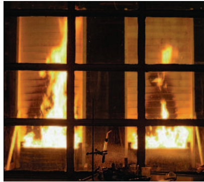
Testing av brannimpregnert kledning ved tilført varme nedenfra.

Brannbeskyttede treprodukter har blitt testet etter samme